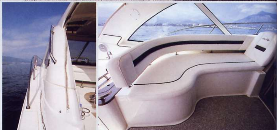
A sinistra, il passaggio laterale è di dimensioni contenute. Sopra, il divanetto a proria consente agli ospiti di conversare con il pilota.