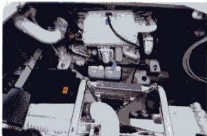
La cala motori ospita due entrobordo Cummins da 540 cv ciascuno.

giore slancio ma soprattutto una forte personalità alle linee. Nato da un progetto realizzato con l'impiego di sofisticati programmi elettronici, il 515 Sundancer si presenta come un robusto e affidabile express cruiser pensato per la crociera a lungo raggio. L'imbarcazione è infatti in grado di offrire il massimo comfort e la dovuta privacy a 4 persone anche per prolungate permanenze a bordo, grazie a due spaziose cabine doppie con bagno privato, unite a grandi spazi per il convivio. La sua carena, caratterizzata da un'importante stellatura prodiera, che si riduce a 19° nelle sezioni poppiere, e da tre pattini di sostentamento per parte, garantisce una navigazione confortevole e sicura.